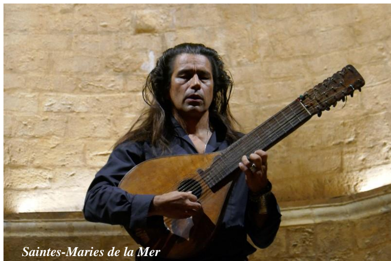
Saintes-Maries de la Mer

Xinarca offre un répertoire autour du chant traditionnel corse (« Cantu nustrale ») monodique : chants sacrés, chants de montagne (chants de bergers, chants de travail), compositions.