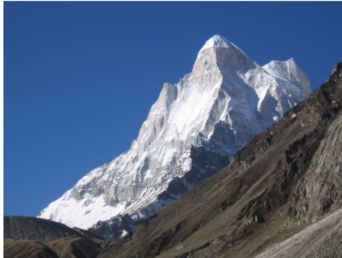
Shivling / Sources du Gange / @AW/chemins de Shanti